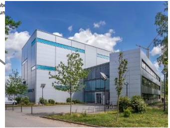
Testzentrum Tragstrukturen Hannover